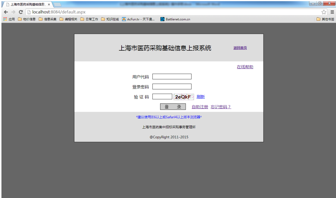
图 1 身份验证

根据上海市医药集中招标采购事务管理所官方网站首页链接提示 ( http://www.yyzbsw.sh.cn ), 进入身份验证页面。使用申领的企业电子编号与登录密码登录系统。验证码区分大小写。