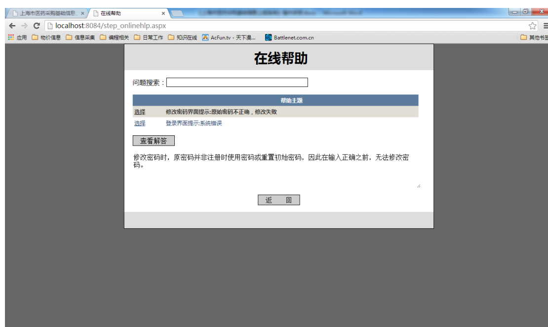
图 11 在线帮助

在问题搜索栏中可搜索问题关键字（汉字）或标题，如有相应解答则在下方表格中显示。点击“选择”按钮并点击查看解答，可查看相应的问题回复。