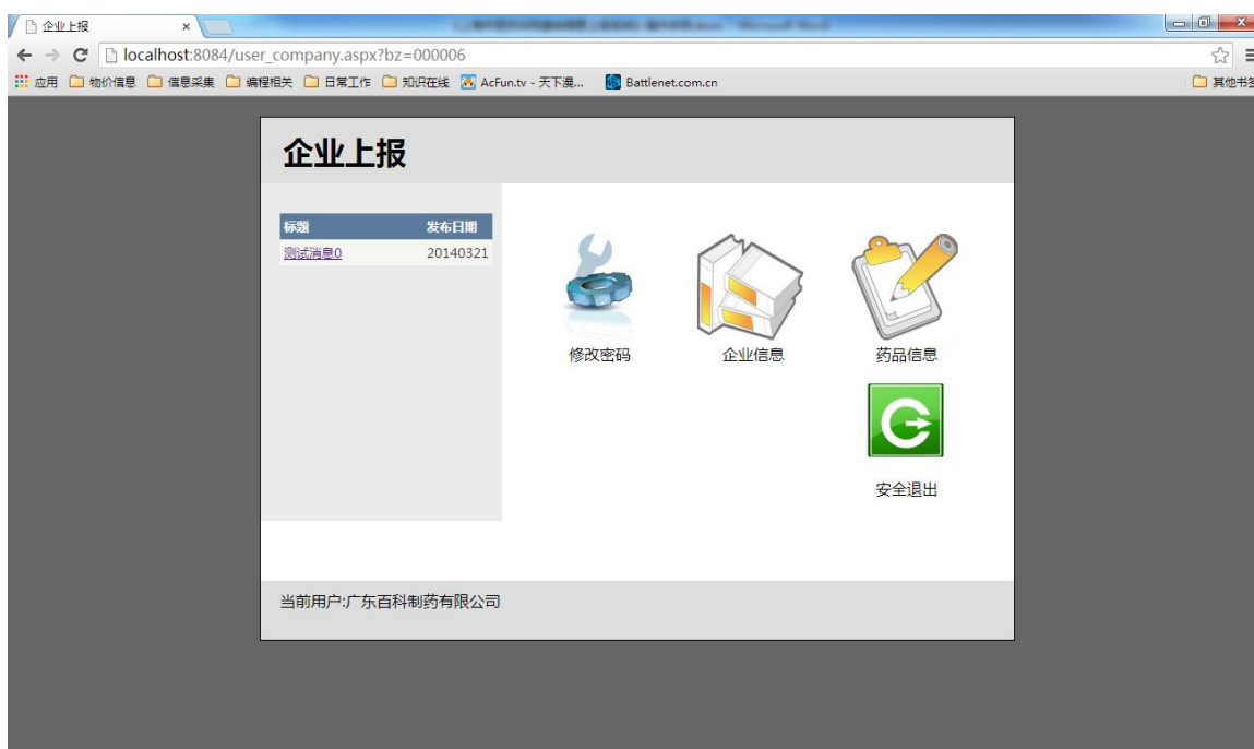
图 4 主界面