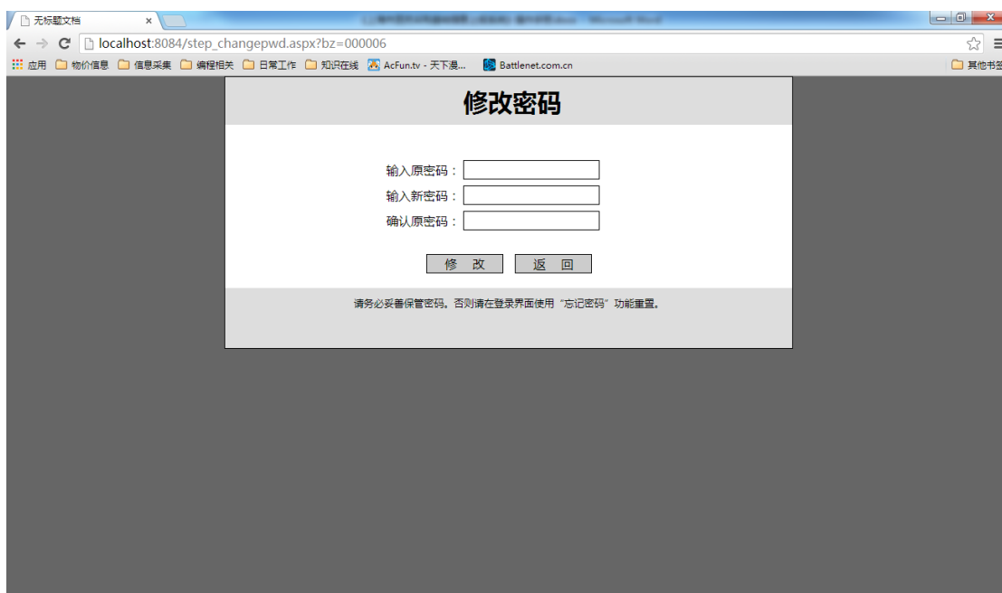
图 5 修改密码