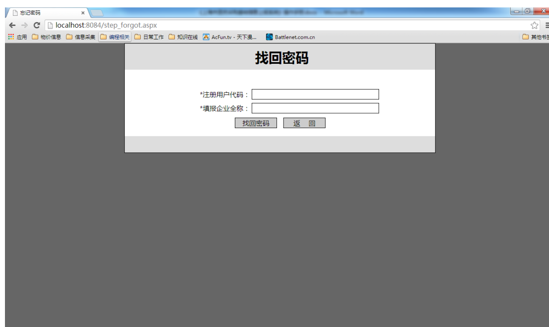
图 3 找回密码

在准确无误地输入注册用户代码和填报企业名称后，系统将自动重置登录密码。此时请企业尽快登录更改密码。